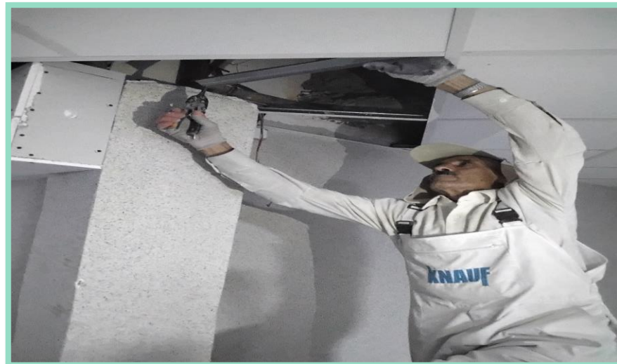
اجرای رفع نقص سقف کاذب پارکینگ منفی سه