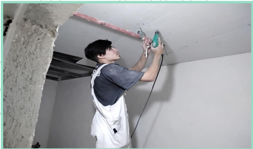
اجرای سقف کاذب انباری های منفی چهار