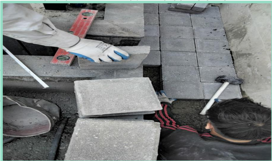
اجرای تکمیل سنگ کف محوطه شمالی