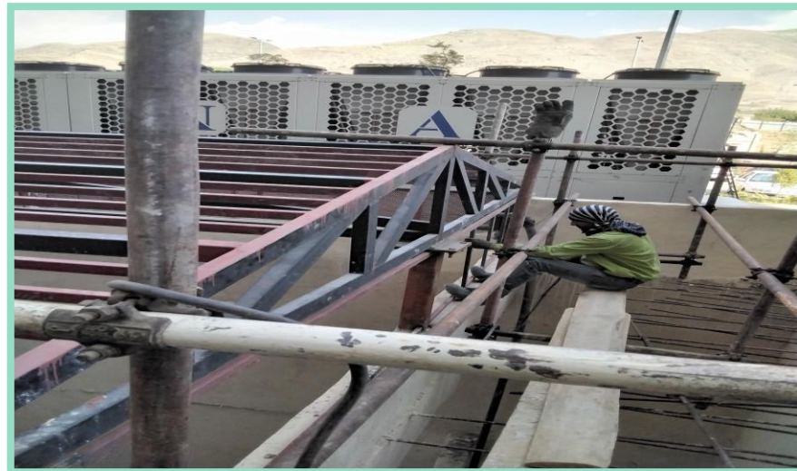
اجرای حفاظ بالای موتورخانه ضلع شمالی