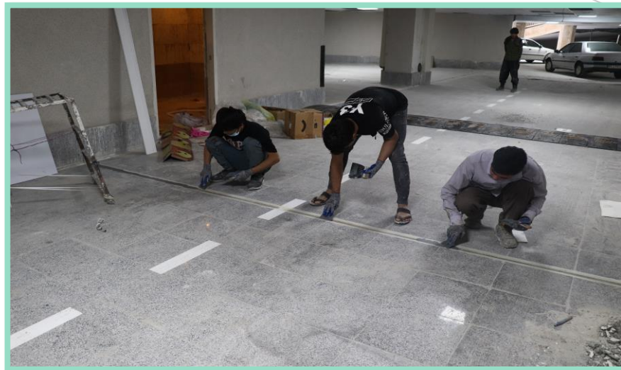
اجرای بتونه کاری درز بین انبساط سنگ کف پارکینگ منفی چهار