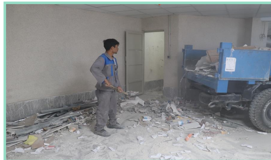
اجرای جمع آوری نخاله از پارکینگ منفی دو