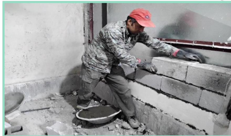
اجرای رفع نقص و تکمیل تیغه چینی پارکینگ منفی چهار