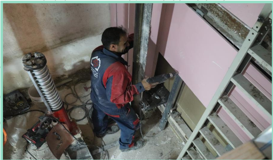
اجرای نصب کناف ضد حریق چاله آسانسور