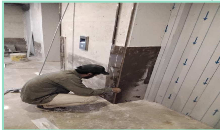
اجرای سرامیک نمای آسانسور ۳ تایی طبقه منفی سه