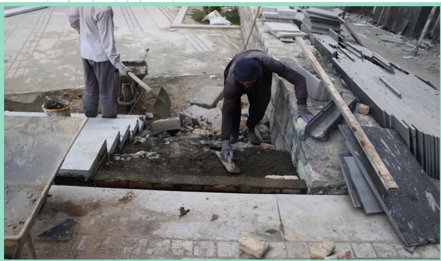
اجرای ساخت پله محوطه شمال غربی