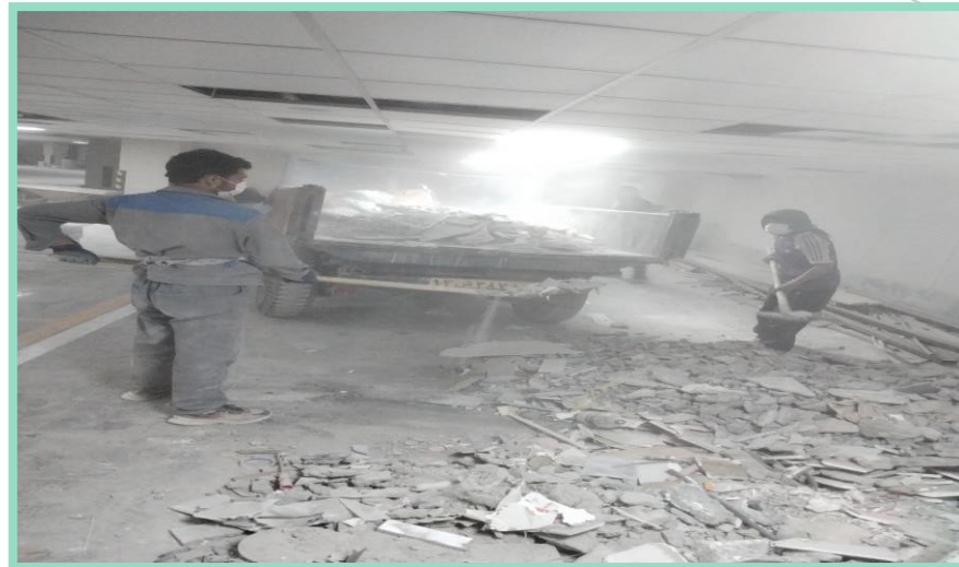
اجرای جمع آوری نخاله پارکینگ منفی چهار