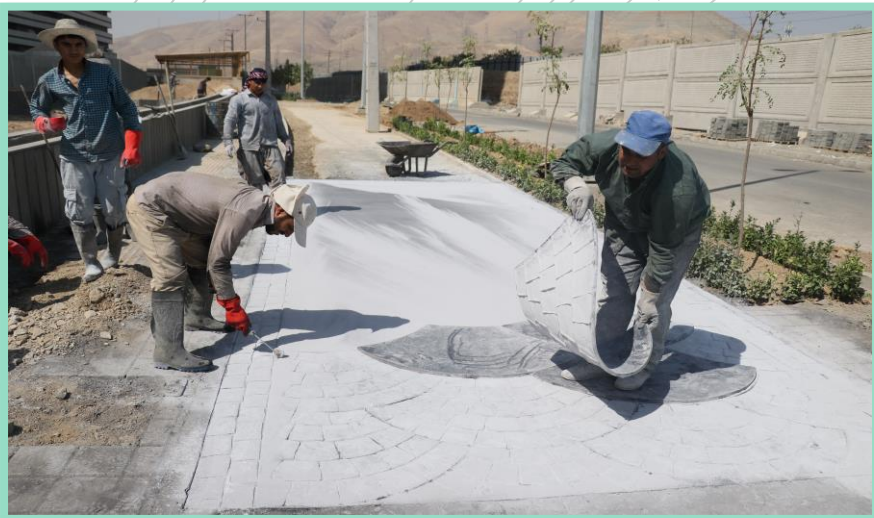
اجرای پیاده رو محوطه شمالی