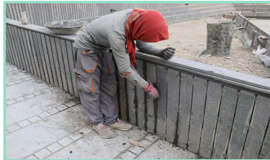
اجرای بند کشی باغچه های فضای سبز محوطه شمال غربی