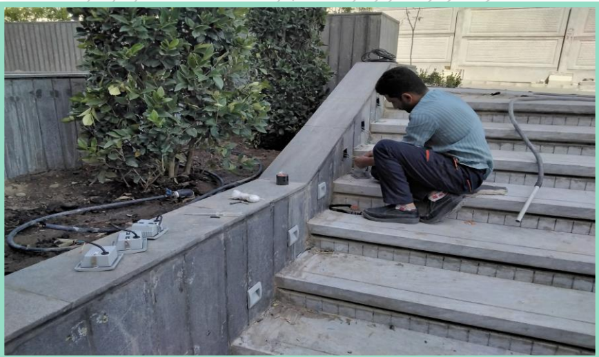
اجرای سیم کشی برق راه پله محوطه شمالی