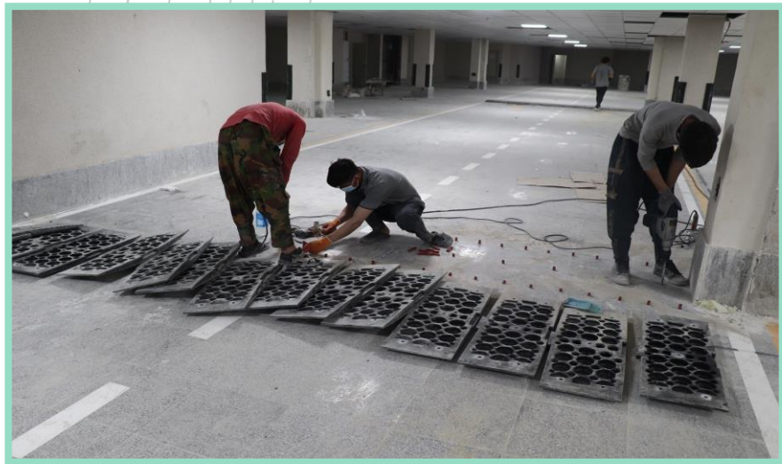
اجرای نصب سرعت گیر طبقه منفی چهار