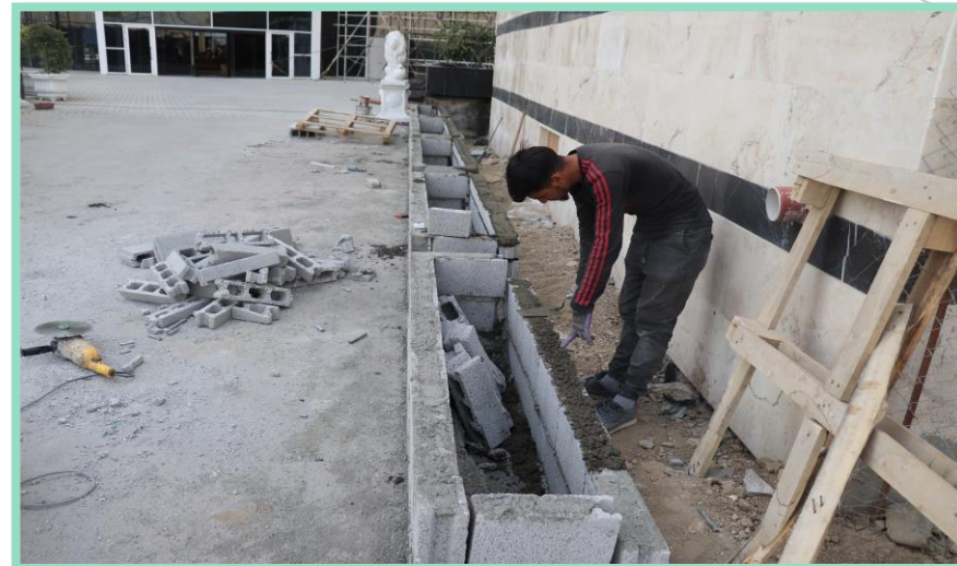
اجرای ساخت باکس گلدان محوطه شمالی