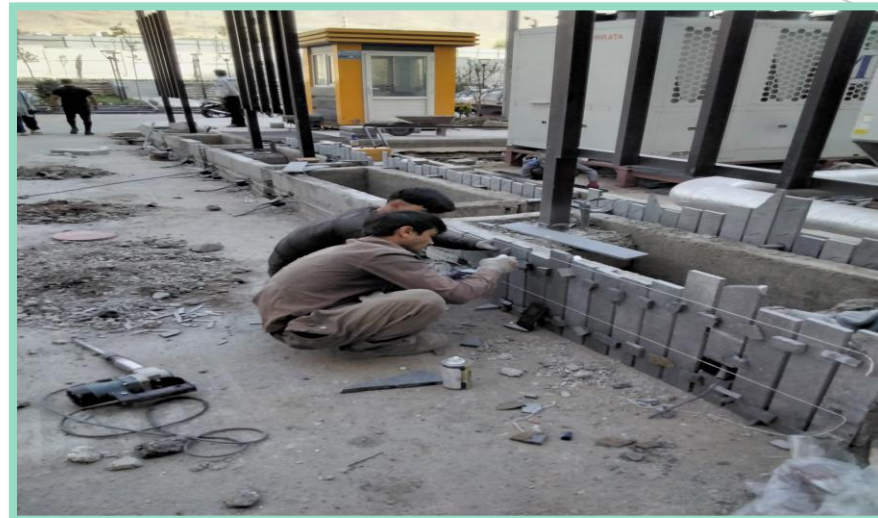
اجرای سنگ کاری باغچه های محوطه فضای سبز شمالی