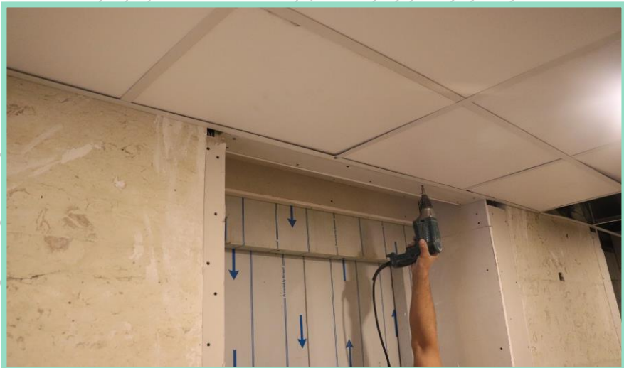
اجرای دور قاب نور مخفی جلو درب آسانسور طبقات منفی