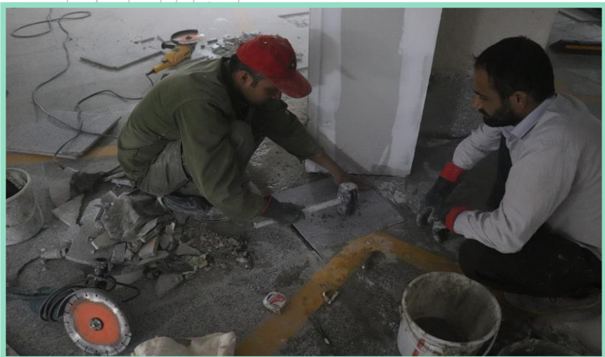
اجرای رفع نقص سنگ کف پارکینگ منفی دو