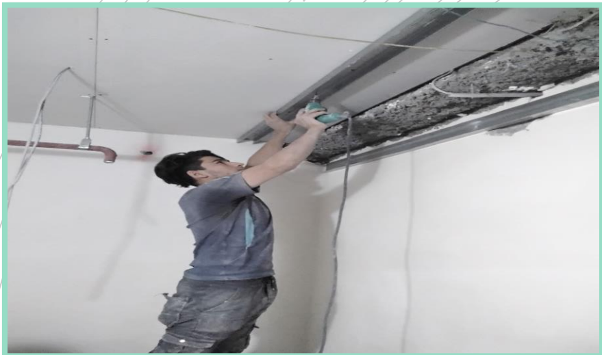
اجرای زیرسازی کفاف سقف انباری ها پارکینگ منفی چهار