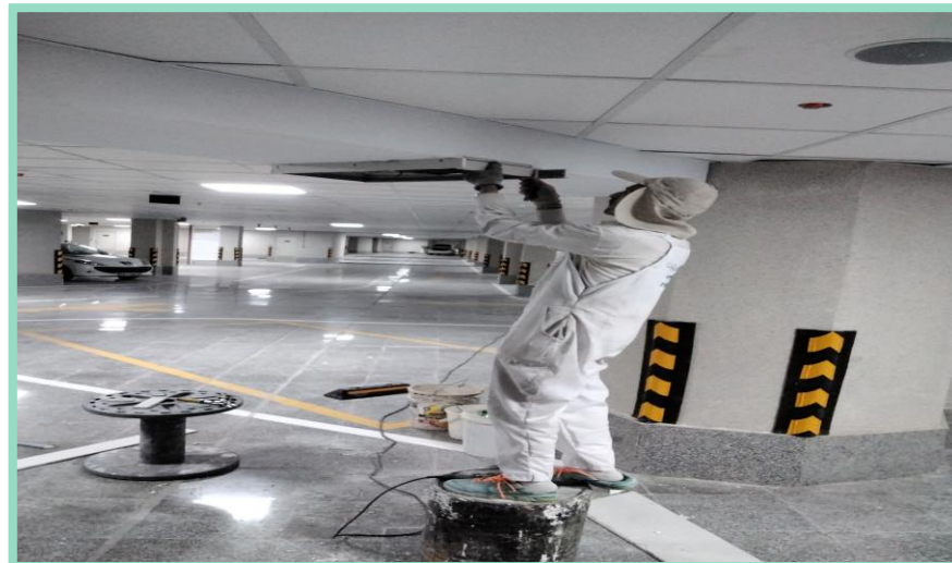
اجرای رفع نقص کناف سقف پارکینگ منفی سه