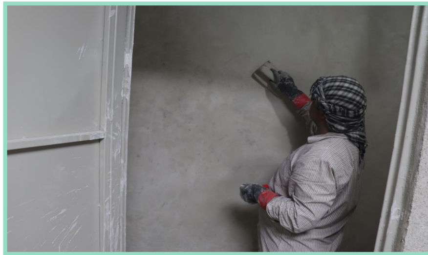
اجرای جمع آوری نخاله از پارکینگ منفی دو