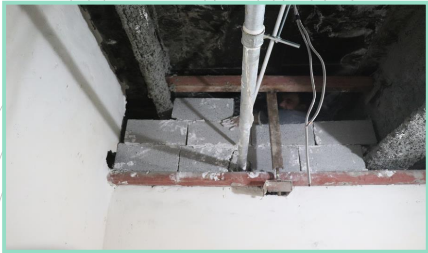
اجرای تکمیل تیغه چینی انباری طبقه منفی دو