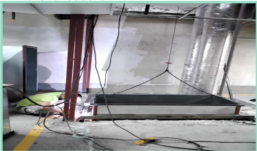
اجرای نصب کانال های اگزاست فن طبقه منفی سه