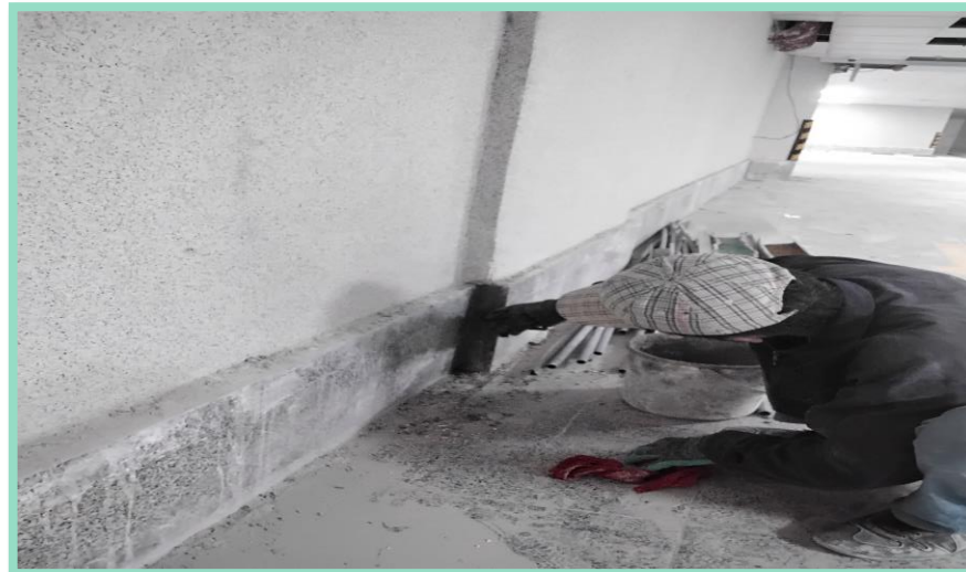
اجرای بند کشی قرنیز پارکینگ منفی چهار