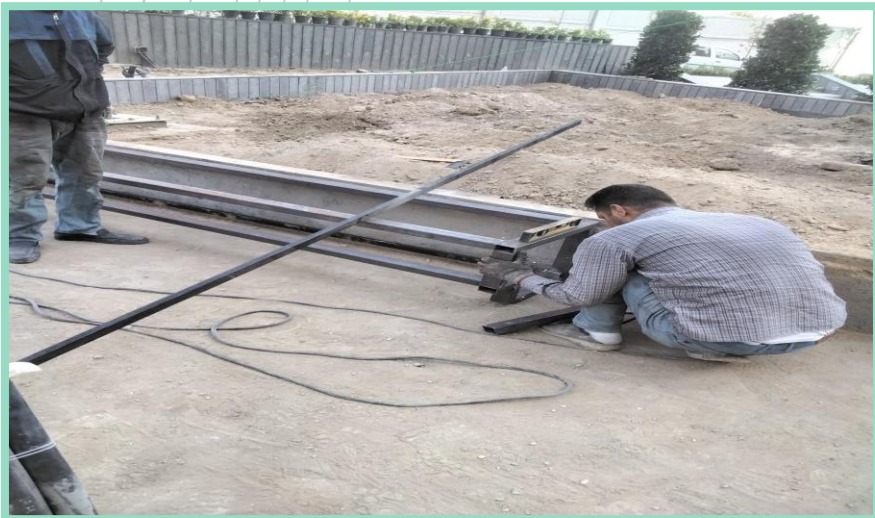
اجرای ساخت و نصب نیمکت زمین بازی محوطه شمالی