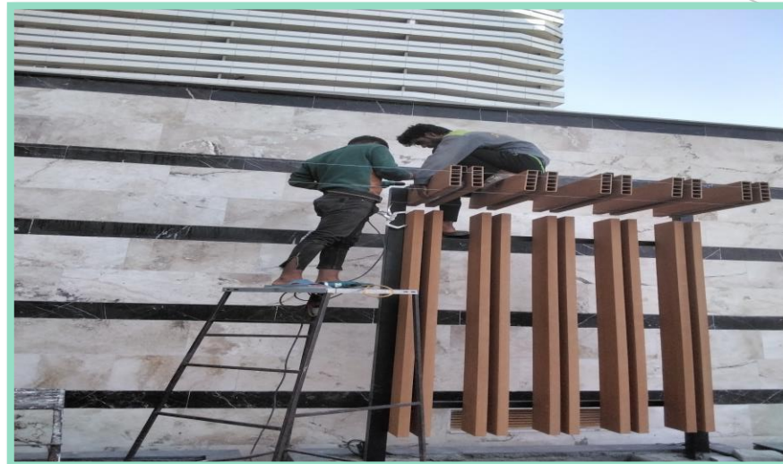
اجرای نصب پرگولا محوطه شمالی