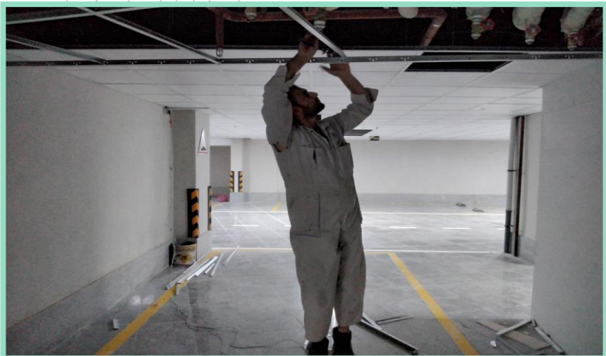
اجرای رفع نقص سقف کاذب پارکینگ منفی سه