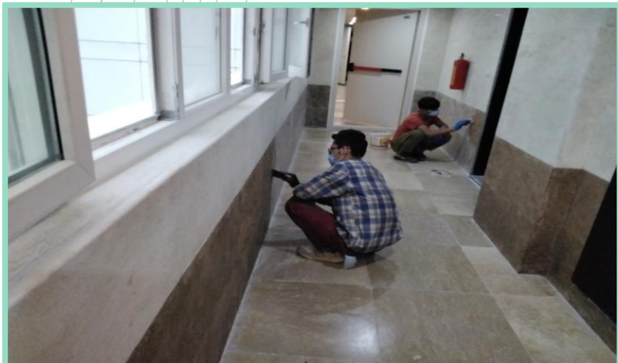
اجرای رزین کاری سنگ راهرو طبقه ۱۷ بال غربی