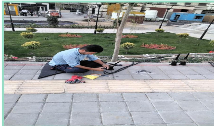
اجرای نصب فلاور باکس محوطه شمالی