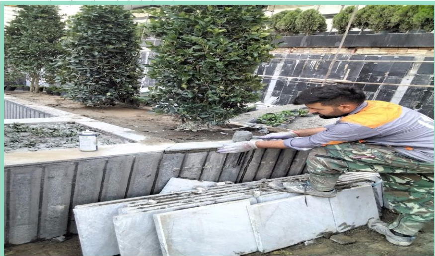
اجرای تکمیل سنگ باغچه های محوطه شمالی