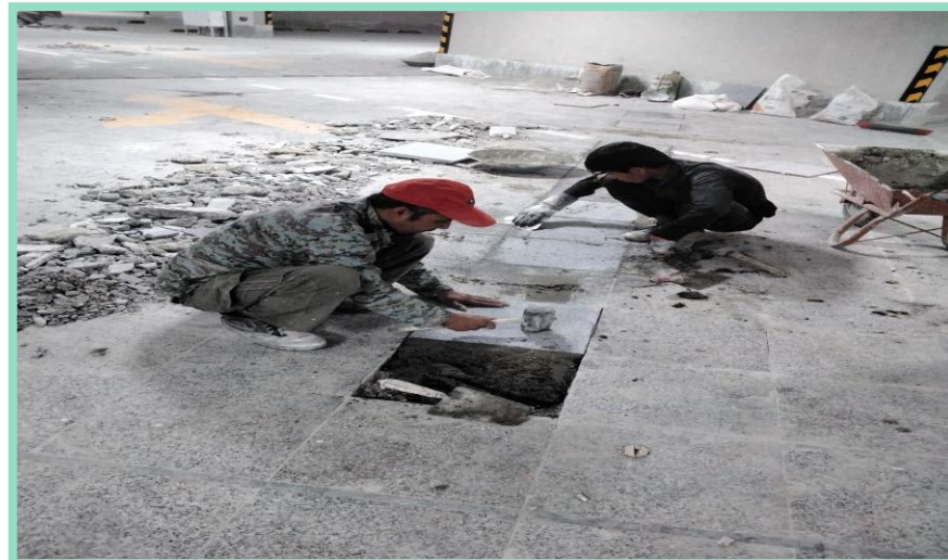
اجرای اصلاح سنگ کف پارکینگ منفی چهار