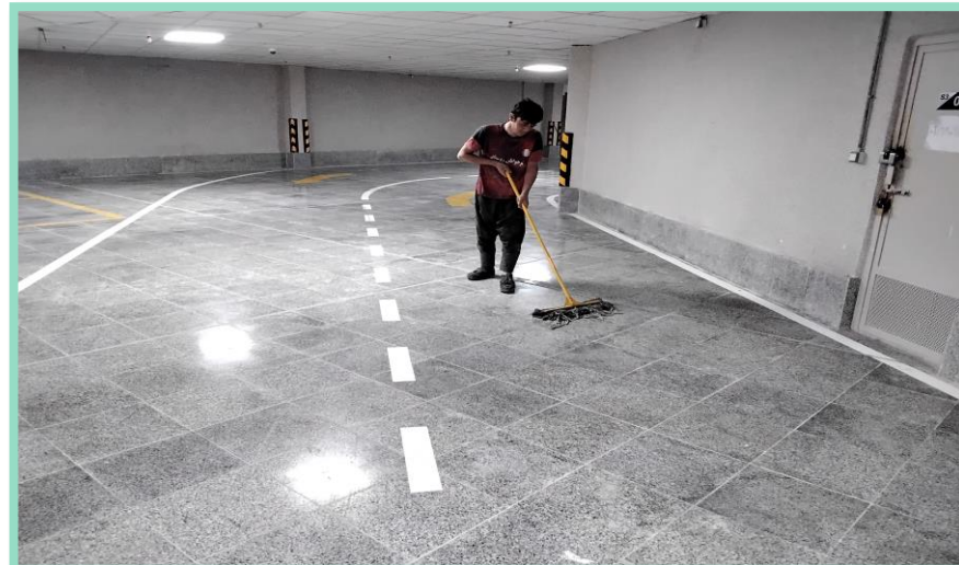
اجرای نظافت پارکینگ منفی سه