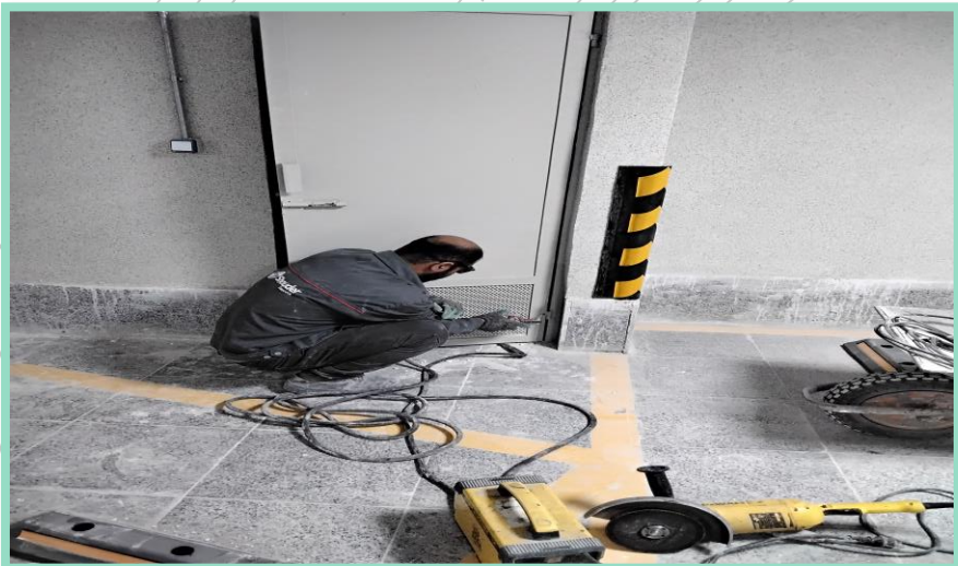
اجرای رفع نقص درب انباری های پارکینگ منفی چهار