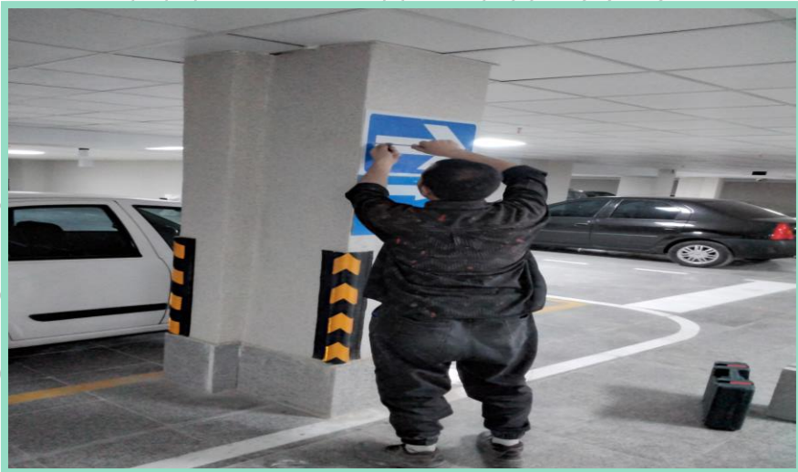
اجرای نصب تابلوهای راهنمایی پارکینگ منفی دو