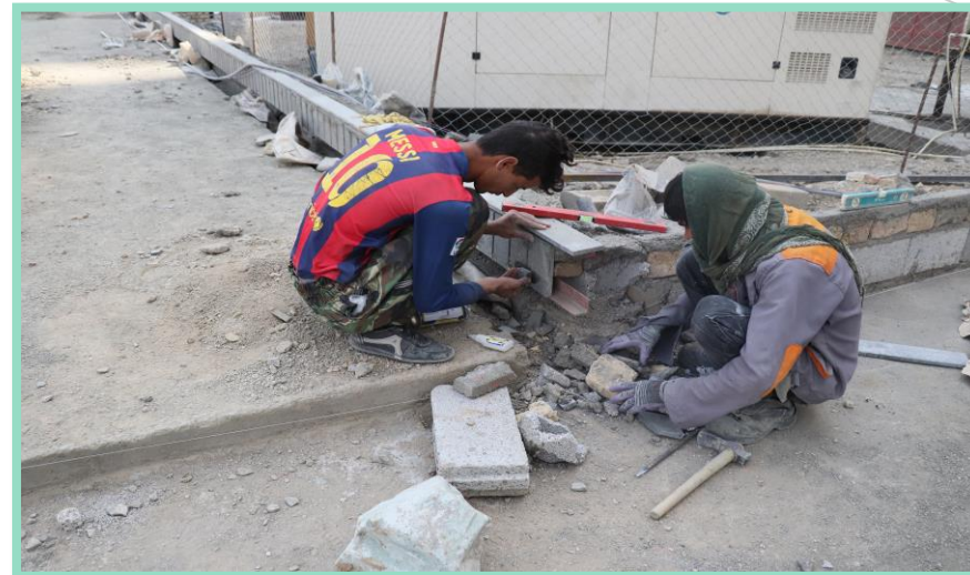
اجرای سنگ کاری دور محوطه بازی کودکان محوطه شمالی