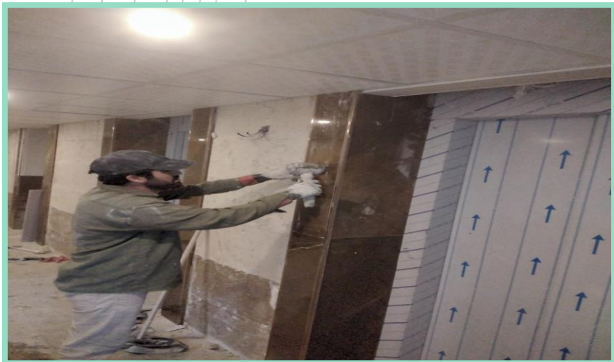
اجرای سرامیک نمای آسانسورها پارکینگ منفی چهار