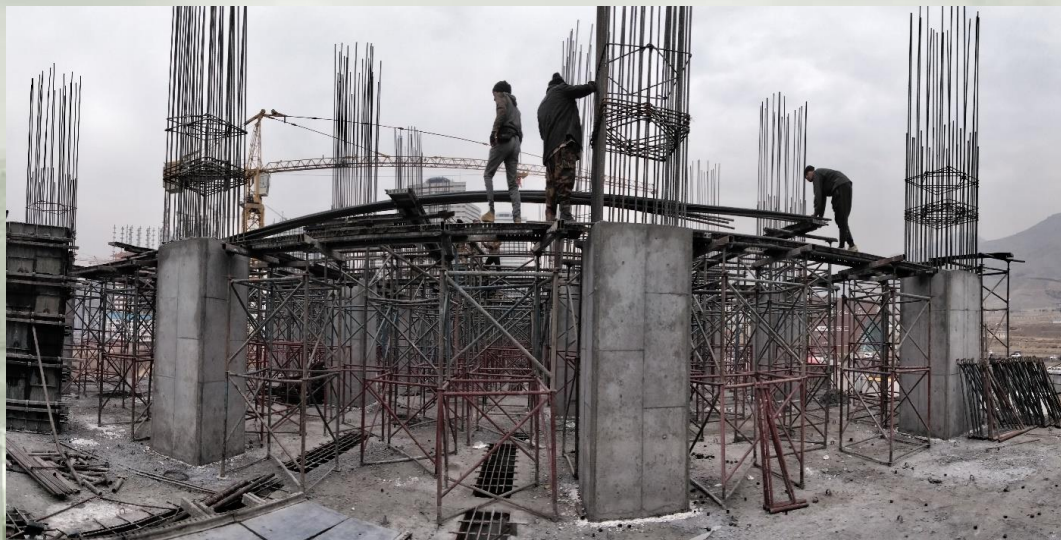
تیرهای سقف طبقه ۳+