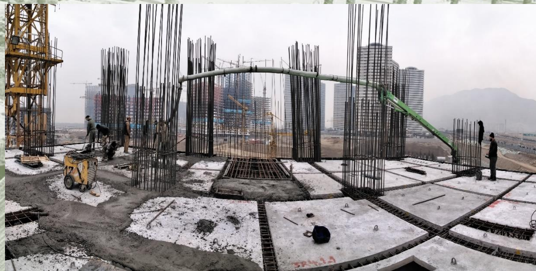
سطح ۴+ زون ۱ بال غربی