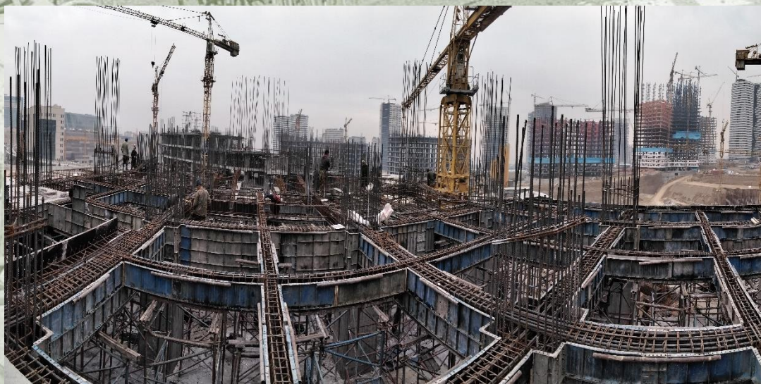
سطح ۴+ زون ۲ هسته مرکزی