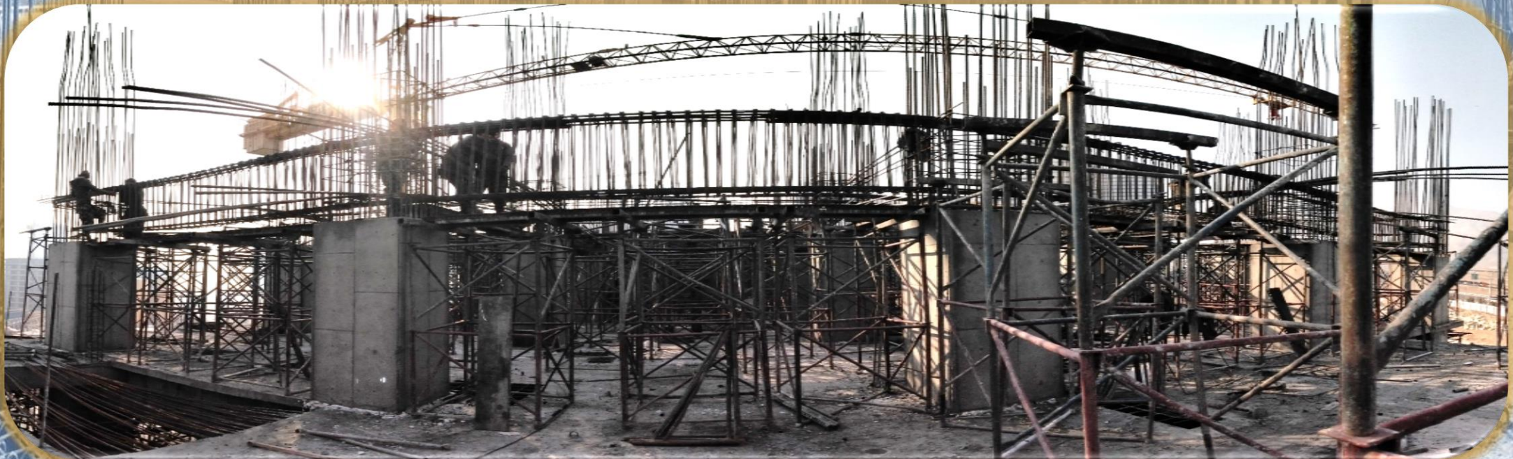
سقف طبقه ۴+ (کف ۵+)