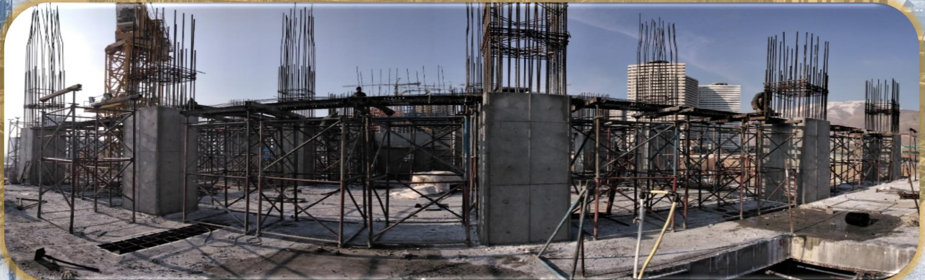
سقف طبقه ۴+ (کف ۵+)