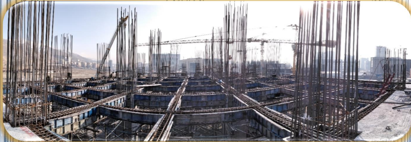
سقف طبقه ۳+ (کف ۴+)