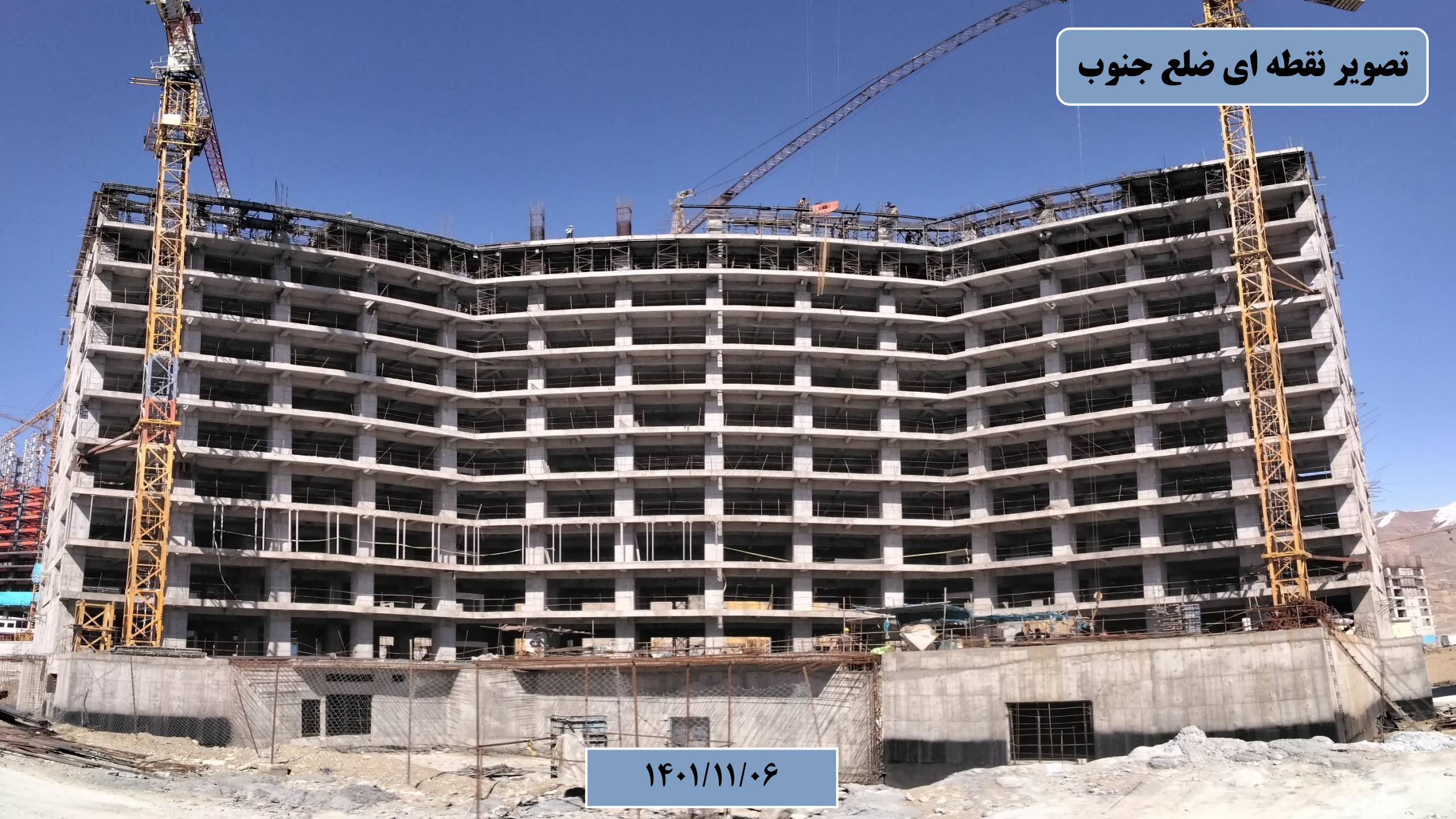
تصویر نقطه ای ضلع جنوب